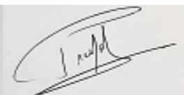
Isabelle PREYAT Signature simple 13/12/2022 13:22:21