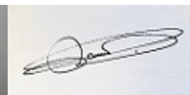
François PAUWELS Signature simple 22/12/2022 10:55:40