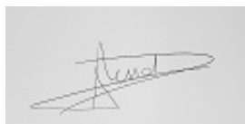
Laetitia RESSORT Signature simple 23/12/2022 18:34:11