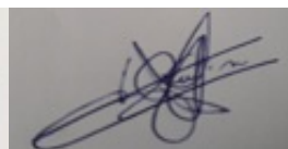
Marie-Dominique RUFIN Signature simple 27/10/2022 15:03:08